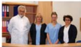
όρεια εκπαιδευμένα προσωπικά

στην περιοχή κωμική και σε απόσταση 5 από τα λιμάνια της αίγινας και της ευβάτης δημιουργήσαμε μία σύγχρονη μονάδα αιμοκάθαρσης με γνώμονα την παροχή θεραπευτικών υπηρεσιών ανθρωπιστικού χαρακτήρα, που καλύπτουν από τα φάσμα των μορφών συνεδρίας όπως αιμοκάθαρση, αιμοδιύλιση και αιμοδιελύθση. Στόχος μας η πραγμάτωση συνεδριών αιμοκάθαρσης υψηλών προδιαγραφών σε νεφροπαθείς που έχουν μόνιμη κατοικία στο νησί και σε φυλοξενούμενους που θα επιλέξουν την αίγινα ως τόπο διακοπών ή αλληγομένους απόδρασης από τα μεγάλα αστικά κέντρα.