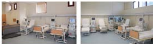
10 θέσεις αιμοκάθαρσης

Η αύξηση των κλινών εντατικής θεραπείας με τις κατάλληλες υλικοτεχνικές και σε νοσηλευτικές υποδομές θα αποσυμφωρούσε το συνωστισμό βαρέων περιστατικών έξω από τις υπάρχουσες μονάδες με αποτέλεσμα κάποιοι συνάνθρωποί μας, να σώζονται αντί να καταλήγουν στο μοιραίο, και περιστατικά εγκεφαλικού θανάτου να μπορούν να αξιοποιηθούν για την δωρεά οργάνων. Επίσης η μη αναφορά των εγκεφαλικών θανάτων από