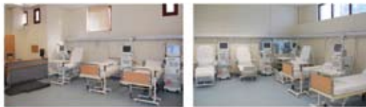
10 θέσεις αιμοκάθαρσης

Η αύξηση των κλινών εντατικής θεραπείας με τις κατάλληλες υλικοτεχνικές και σε νοσηλευτικές υποδομές θα αποσυμφωρούσε το συνωστισμό βαρέων περιστατικών έξω από τις υπάρχουσες μονάδες με αποτέλεσμα κάποιοι συνάνθρωποί μας, να σώζονται αντί να καταλήγουν στο μοιραίο, και περιστατικά εγκεφαλικού θανάτου να μπορούν να αξιοποιηθούν για την δωρεά οργάνων. Επίσης η μη αναφορά των εγκεφαλικών θανάτων από