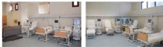
10 θέσεις αιμοκάθαρσης

Για τους νεφροπαθείς Ελπίζουμε ο νέος θεσμός να επανδρωθεί με ειδικότητες νεφρολόγων ιατρών ώστε να γνωρίζουν το αντικείμενο, τις ιδιαιτερότητες του, την θεσμοθετημένη νομολογία και να εκδίδουν αντικειμενικά τις αποφάσεις τους περιορίζοντας την ταλαιπωρία και τις διαφορετικές αποφάσεις για το ίδιο θέμα όπως αυτές εκδίδονταν στο παρελθόν από υγειονομικές επιτροπές στις οποίες συμμετείχαν ιατροί ξένων ειδικοτήτων προς την νεφροπάθεια.