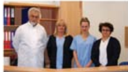
Άρτια εκπαιδευμένα προσωπικά

Στην περιοχή κωμική και σε απόσταση 5' από τα δημόσια της αίγιναις και της συμβόλης δημιουργήσαμε μία σύγχρονη μονάδα αιμοκάθαρσης με γνώμονα την παροχή θεραπευτικών υπηρεσιών ανθρωπιστικού χαρακτήρα, που καλύπτουν όλο το φάσμα των μορφών συνεδρίας όπως αιμοκάθαρση, αιμοδιύλιση και αιμοδιελύθση.